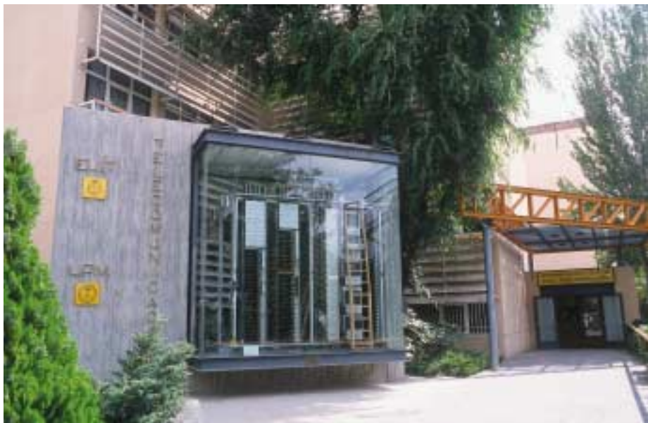
Escuela de Ingeniería Técnica de Telecomunicación de la Universidad Politécnica de Madrid.